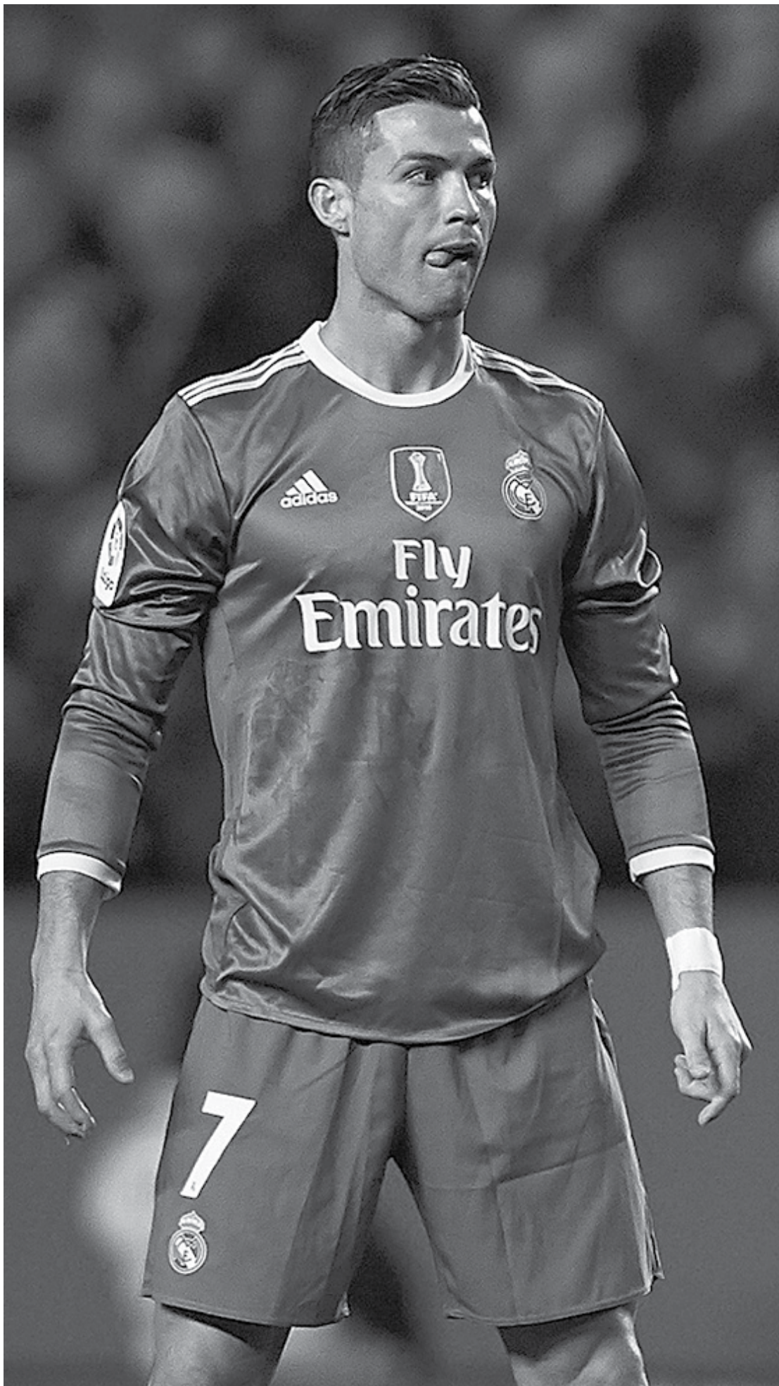
Depois da saída de Neymar, agora é a vez de Cristiano Ronaldo falar em deixar a Espanha na janela de transferência