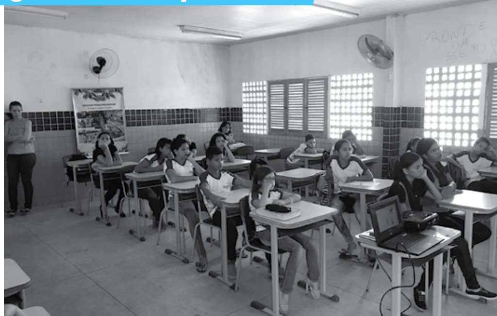
Objetivo é proporcionar formação continuada aos professores de Inglês e um curso de Inglês complementar