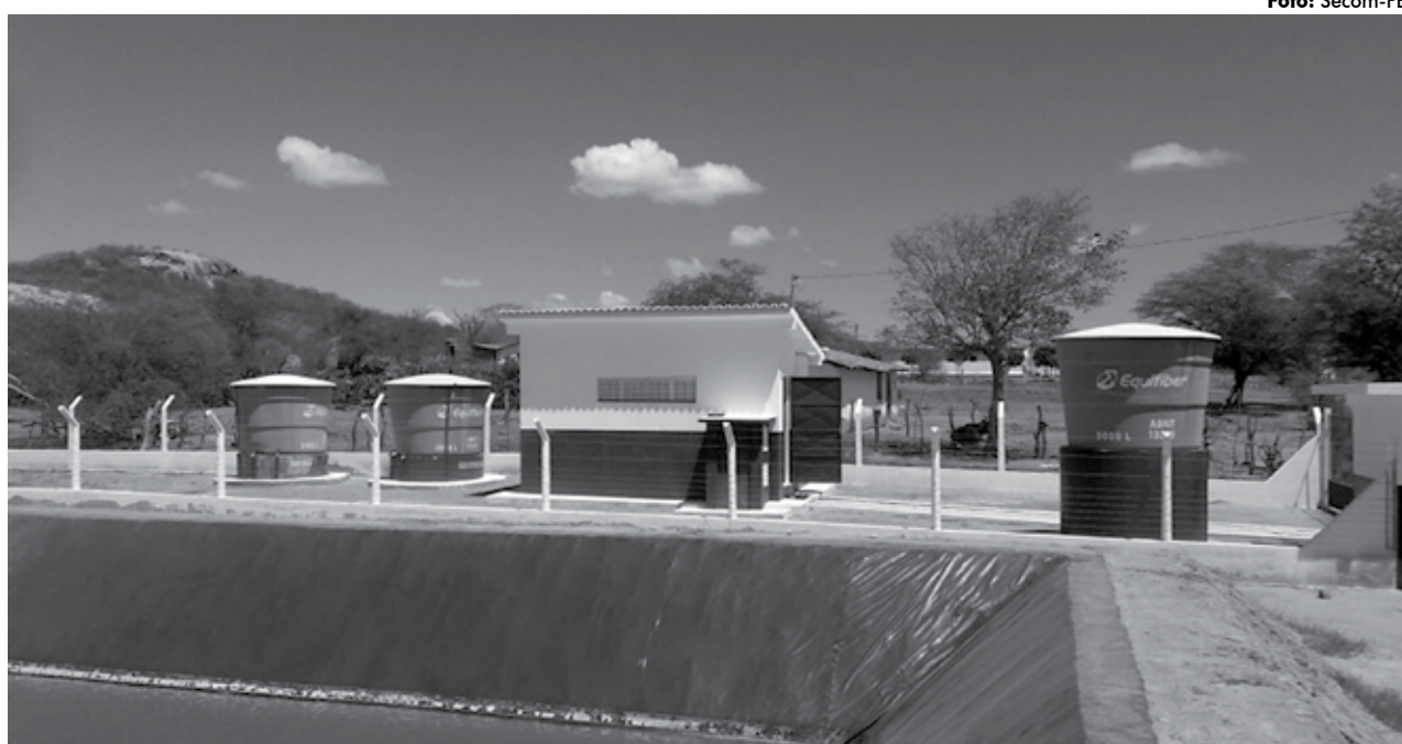
Obras de esgotamento sanitário também fazem parte das ações complementares ao Projeto de Integração ao Rio São Francisco

Obras de esgotamento sanitário também fazem parte das ações complementares ao Projeto de Integração ao Rio São Francisco. O Governo do Estado está estruturando a rede de esgoto nos municípios de Belém de Brejo do Cruz, Coremas, São Bento, São José de Piranhas, Cabaceiras, Carauabas, Coxixola, Livramento e São José dos Cordeiros, Serra Branca e Taperoá. Nestas ações, os investimentos já ultrapassam R$ 76 milhões.