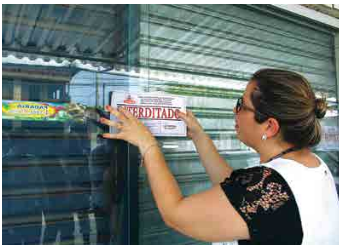
Farmácia foi interditada durante fiscalização do MP-Procon, Vigilância Sanitária da capital e Receita Estadual

Uma farmácia foi interdita no início da tarde de ontem, no bairro do Jardim Veneza, na capital, durante fiscalização realizada pelo MP-Procon, Gerência de Vigilância Sanitária de João Pessoa e Receita Estadual. O responsável pela farmácia foi preso em flagrante por crime contra as relações de consumo (Lei nº 8.137/1990) e conduzido para a Central de Polícia.