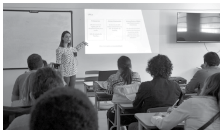
Palestra ocorreu na Escola Estadual Gonçalves Dias, no bairro do Cristo