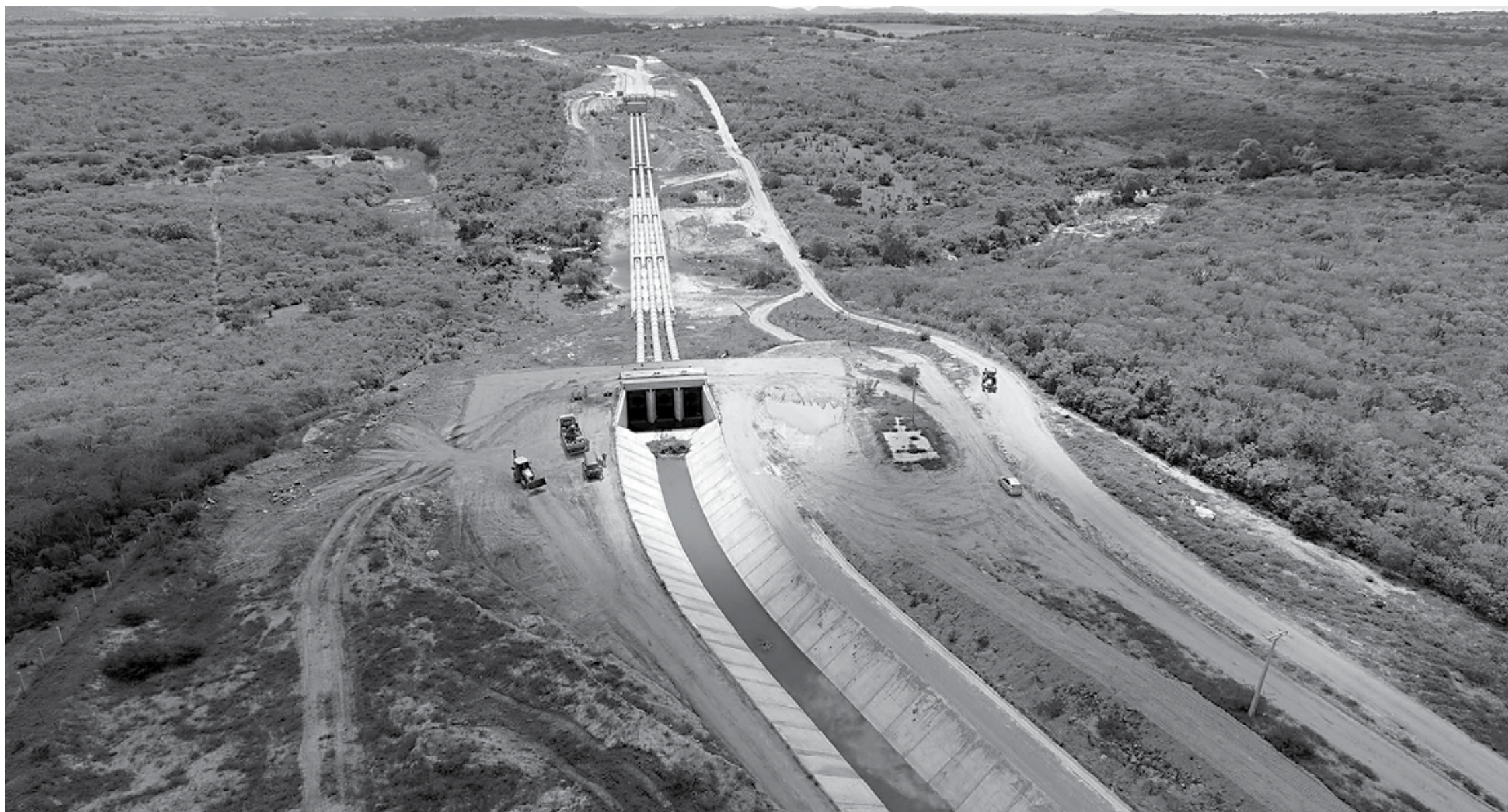
Obras incluem itens que vão desde a instalação de sistemas de esgotamento sanitário à construção de grandes equipamentos, como o sistema adutor TransParaíba; 1.386km de adutoras já foram construídos pela Secretaria de Recursos Hídricos