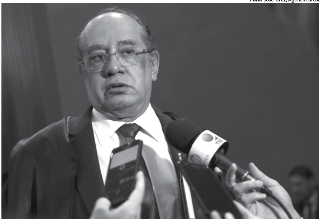
O ministro Gilmar Mendes recebeu duras críticas da Associação Nacional dos Procuradores da República

A Associação Nacional dos Procuradores da República (ANPR) divulgou ontem uma carta aberta direcionada aos ministros do STF (Supremo Tribunal Federal) em que pede providências em relação à atuação do ministro Gilmar Mendes, que, para a entidade, coloca em dúvida a credibilidade do tribunal. A entidade representa cerca de 1.300 procuradores da República em todo o país.