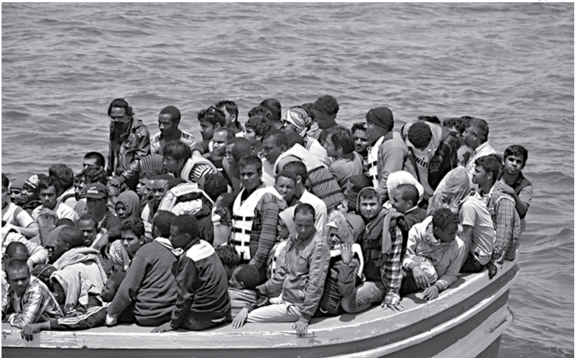
A principal rota escolhida por refugiados e imigrantes para chegar à Europa é o Mar Mediterrâneo, onde têm acontecido constantemente naufrágios de embarcações com centenas de mortos

Mesmo com a queda no número de chegadas de imigrantes, o estudo revela que