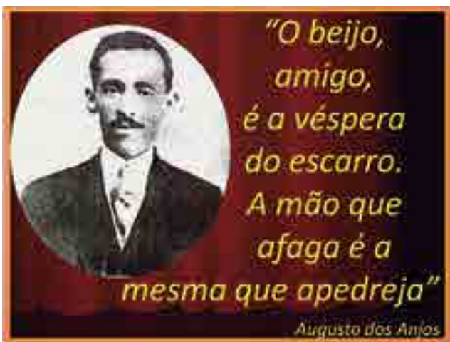
Augusto dos Anjos

Acho que teria sido um grande momento para algum dos poderes públicos, em parceria com empresas privadas, "comprar" a ideia. Poderia ter sido a grande "refestança" poética de Augusto em todo o País, com o nome da Paraíba "lá em cima".